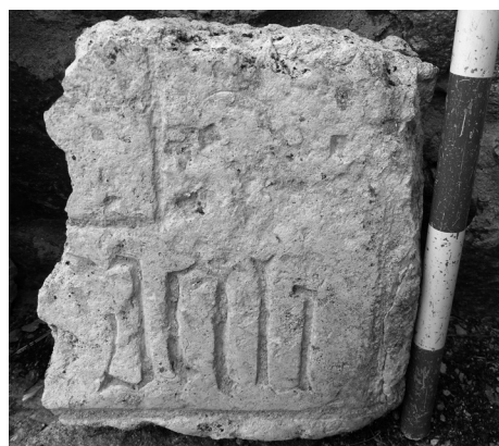
Figura 5. Fragmentos de lápidas funerarias que aparecieron durante la reforma de una vivienda, en Sonsoto.

características marcas de la labra a hacha propias de la época románica. Algunas de ellas tenían forma de dovela, por lo que podrían haber formado parte de un arco.