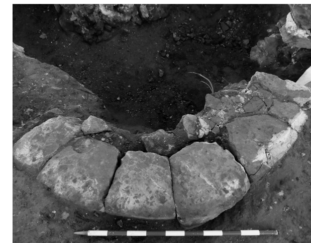
Figura 2. Elementos documentados de la base para la pila bautismal.

Teniendo en cuenta la forma y composición de