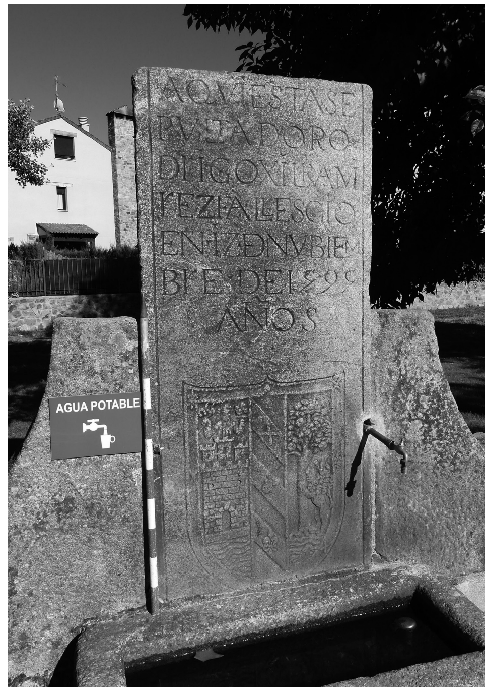
Figura 6. Lápida funeraria, hoy decorando la fuente de Sonsoto.

biéndose desmontado algunas de ellas para abrir una ventana y quedando ocultas las demás por un enfoscado de cemento.