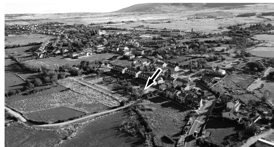
Figura 1. Imagen aérea del lugar del hallazgo.

El hallazgo se produjo en septiembre del año 2020, de manera casual, en el transcurso de las obras de cimentación para la ejecución de una vivienda unifamiliar en la calle de La Mesta –en el actual barrio de Sonsoto– de Trecasas (Segovia), justo en el entorno inmediato donde las fuentes orales ubicaban, de una manera un tanto imprecisa, la que fue la iglesia parroquial de Sonsoto (Figura 1). Este hallazgo motivó una intervención arqueológica preventiva por parte de los servicios de arqueología de Caminos del Románico, con objeto de obtener la documentación y valoración de los restos materiales aparecidos 25 .