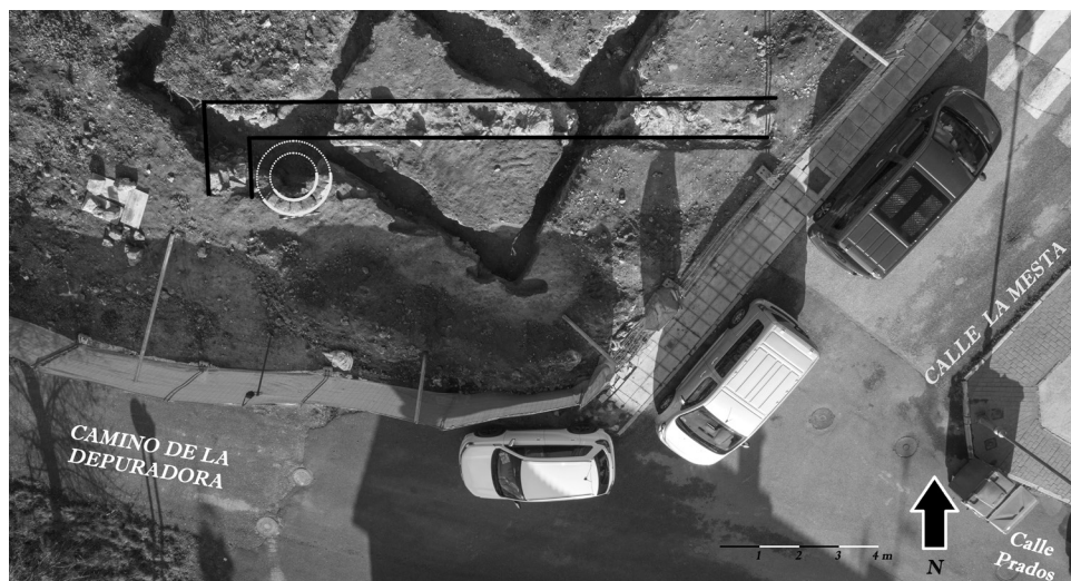
Figura 4. Vista aérea con los restos documentados de la iglesia de Sonsoto.

De este modo, estas piezas, sin ningún lugar a dudas, son materiales constructivos que en su momento formaron parte de la iglesia de San Pedro de Sonsoto. Las características de estas piezas (labra y motivos decorativos) nos permiten afirmar que se trataba de una iglesia cuyo origen se ubica en un horizonte cultural adscrito al románico, construida, muy probablemente, con anterioridad a la segunda mitad del siglo XII, dentro de lo que se denomina el primer impulso constructivo del contexto de la repoblación de las tierras de Segovia entre finales del siglo XI y mediados del siglo XII. Este dato se ajusta muy bien a las características y dimensiones que tendría la iglesia en base a los restos murarios documentados: una sencilla iglesia, de dimensiones modestas, de nave única rematada en un único ábside. Características acordes con la tipología de las primeras construcciones románicas presentes en la provincia de Segovia (Figura 4).